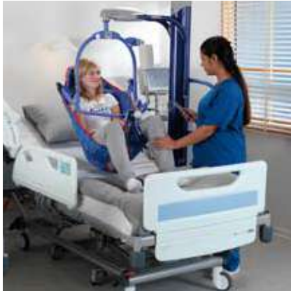
Un medio seguro y fácil para posicionar pacientes en la cama ...