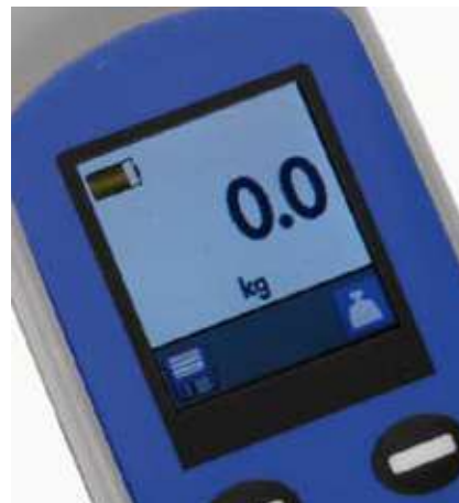
El nivel de energía en la batería es visualizado con claridad.

Esta grúa demostrada y totalmente probada ha sido fabricada para durar y funcionará con seguridad y fiabilidad, brindando un rendimiento óptimo durante una larga vida de servicio.