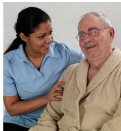
Soluciones totales pensando en las personas.