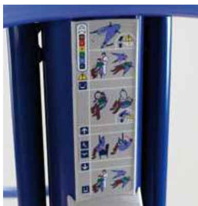
Panel con resumen de instrucciones para el usuario siempre disponible cuando se necesita.