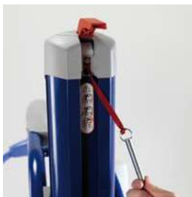
El sistema de bajada de emergencia permite bajar al paciente sin necesidad de usar herramientas.