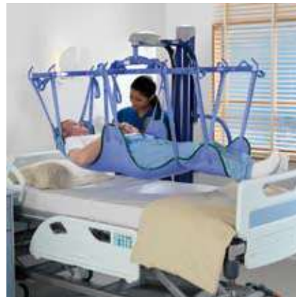
Una solución óptima para el levantamiento de pacientes en posición supina en centros de cuidados intensivos ...