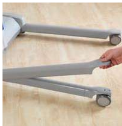
Cubiertas para el chasis desmontables fáciles de quitar para la limpieza.