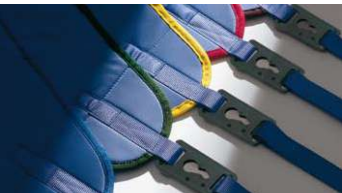
Slings para necesidades individuales.