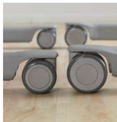
Ruedas de baja altura para facilitar el acceso al lado de la cama.