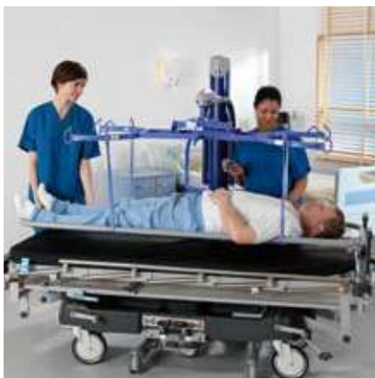
... o levantar pacientes tumbados en camillas.

Buena estabilidad es fundamental para el funcionamiento seguro de la grúa y la sensación de seguridad del paciente durante las transferencias. Maxi Move se basa en un principio de levantamiento que asegura una excelente estabilidad.