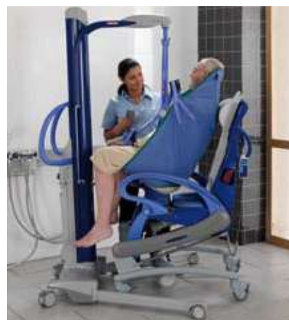
Maxi Move se integra bien con Carendo.