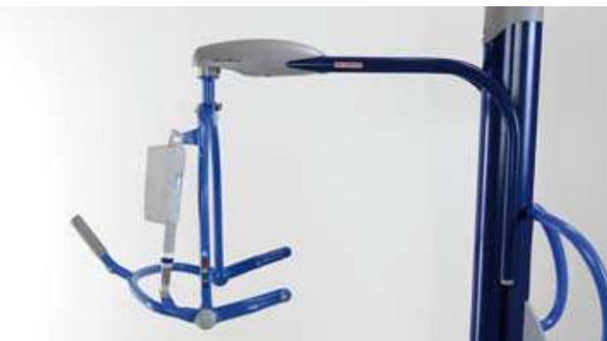
Brazo extensor para máximo alcance.