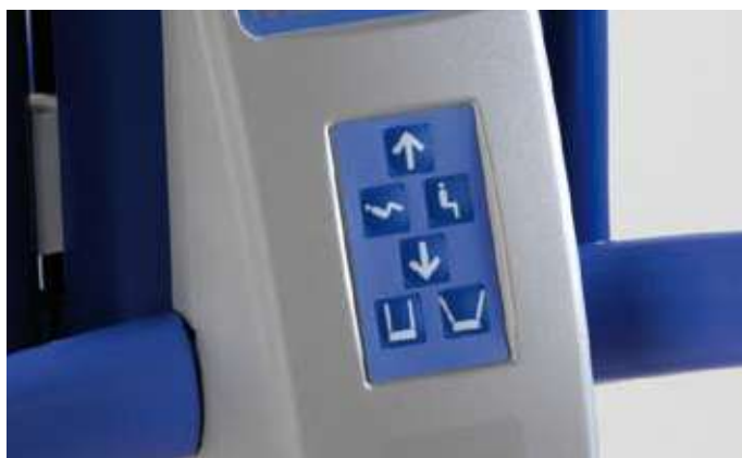
Función de control doble; Maxi Move puede accionarse desde el panel de control o desde el mando de control.