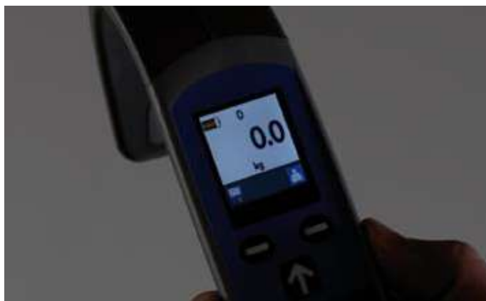
Pantalla con visualización iluminada.

El mando de control está fabricado con un material extremadamente duradero con un gancho integrado para facilitar su colocación en la grúa.