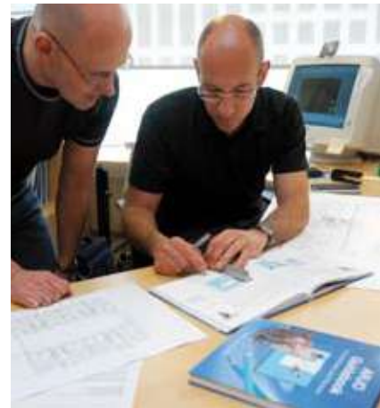
Asesoramiento para arquitectos sobre la planificación de centros de cuidado.