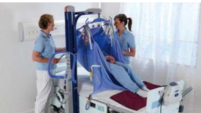
Facilitan el reposicionamiento en cama con el sling de camilla.

El accesorio Combi es un dispositivo de bloqueo seguro y fácil de usar para todas las grúas de movilización pasivas ArjoHuntleigh que facilita el intercambio entre la selección de bastidores y camillas más amplia del mercado.