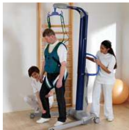
... sesiones de rehabilitación usando el singular chaleco para caminar ...