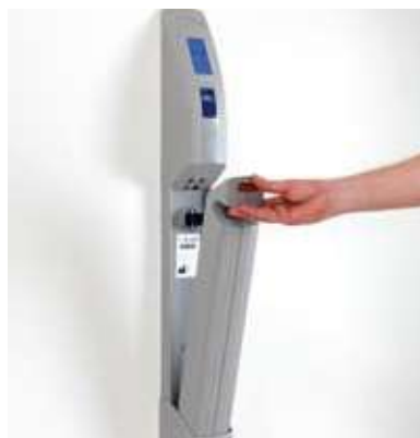
Conveniente cargador de baterías montado en la pared.