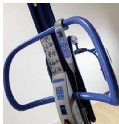
Asas ergonómicas que facilitan unas maniobras suaves.