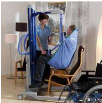
... transferir pacientes a sillas ...