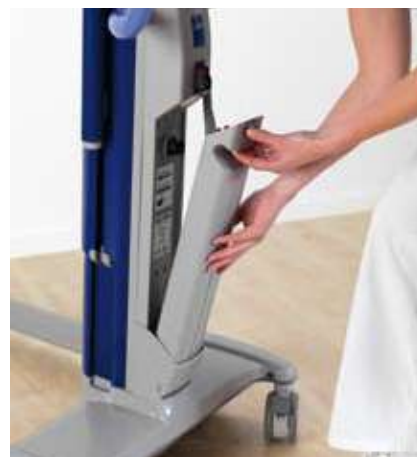
Cambiar la batería es fácil.