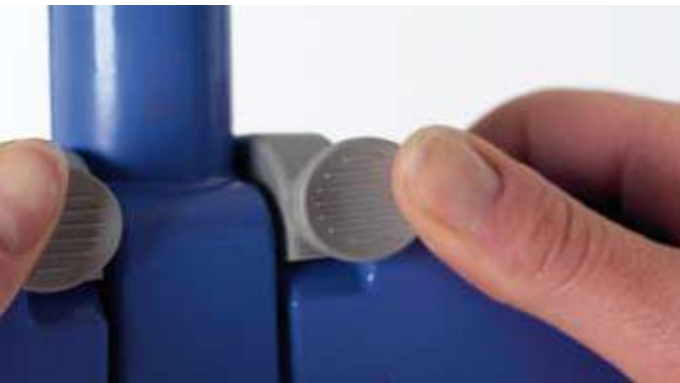
Accesorio Combi para máxima flexibilidad.