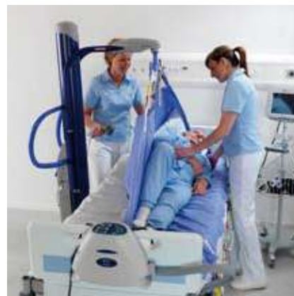
... o para reposicionamientos y cambios posturales a pacientes postrados en cama.