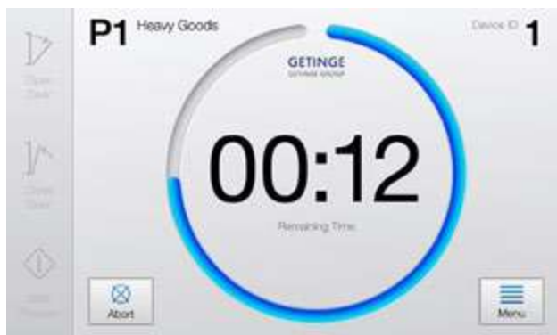
Visualización del estado de un vistazo. Tiempo restante de fácil visualización, incluso desde lejos.

Las pantallas de gran tamaño y resolución son fáciles de leer y permiten que el personal vea y supervise el estado a distancia, aumentando aún más la satisfacción del usuario y la productividad. Con CENTRIC, Getinge da otro gran paso para ofrecer innovadoras soluciones integradas y orientadas al usuario.