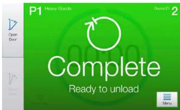
CENTRIC proporciona información clara y ordenada: solo lo que necesita en cada fase, nada más.