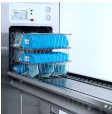
Sistema de carga y descarga automático para cestas (GL64B).