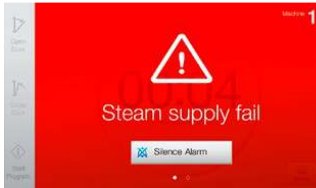
Todas las alarmas que se activan se acompañan de instrucciones claras en pantalla que le indican qué acciones realizar. Sin confusiones, ni estrés, ni pérdidas de tiempo.