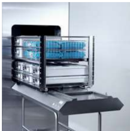
Sistema de carga y descarga automático para racks (GL64SR).

Los sistemas de carga y descarga automáticos GL64 de Getinge son sistemas totalmente automáticos para cargar y/o descargar productos en un esterilizador GSS67H de Getinge. El sistema optimiza la manipulación de los productos sin necesidad de la supervisión directa de un usuario. Los sistemas de carga y descarga automáticos ofrecen un flujo de trabajo ergonómico al personal, ya que evitan la manipulación manual de los productos.