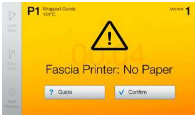
CENTRIC le ofrece ayuda en línea clara y fácil de entender para resolver problemas o acceder a funciones avanzadas.