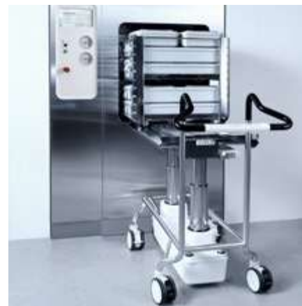
Carros SMART de carga y descarga.