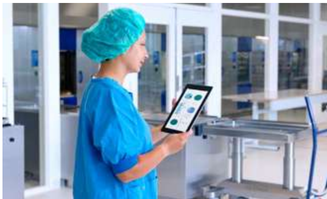
Getinge Online le ayuda a resolver problemas de forma rápida y proactiva para que pueda trabajar sin interrupciones.

Al poder acceder fácilmente a los datos, las rutinas de trabajo se optimizan, garantizando el tiempo útil de producción de los equipos.