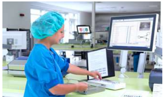
Garantice una trazabilidad absoluta para el paciente con T-DOC.

T-DOC permite la planificación de la producción en la CSSD en función de las operaciones previstas, por lo que se optimiza el flujo de trabajo estéril. Al ser compatible con todos los tipos de sistemas hospitalarios, T-DOC permite configurar carros optimizados y personalizados para pacientes, que incluyan consumibles y productos propios, así como planificación financiera, informes avanzados y el compromiso constante de cumplir con la rentabilidad y la seguridad de los pacientes.