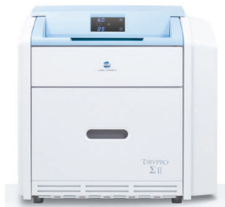
Konica Minolta DRYPRO Sigma II